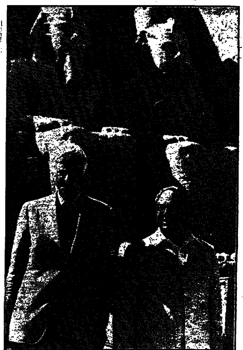
الرئيس ناسون مع وزير الصناعة المصري السيد طه زكي قسي معيد ابو سنبل .